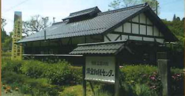
須金和紙センター