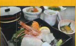
かんぼの宿 光 ● 刺身定食