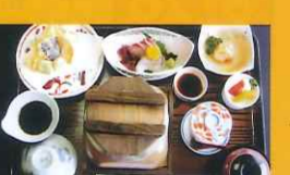
紫水園 ● ゆの花御膳