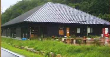
せせらぎ・豊鹿里パーク