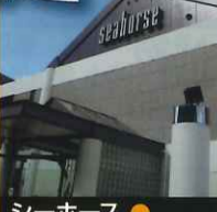
シーホース ● 親子ツアー特別コース