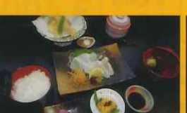
国民宿舎大城 ● 笠戸ひらめ御膳